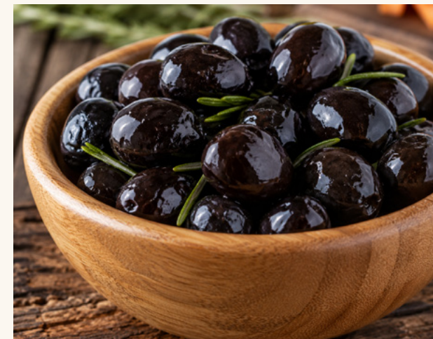
Olives noires Confites, parfumées, longue conservation.