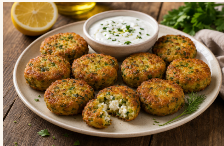
Beignets courgette à la feta Galettes moelleuses, feta et herbes fraîches.