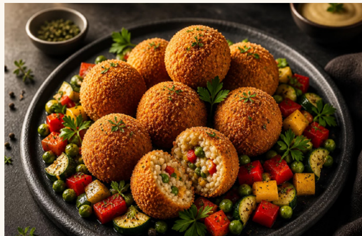
Croquetas aux légumes

Morue effilochée, béchamel crémeuse, panure dorée.