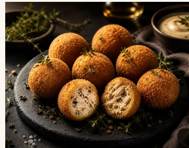
Croquetas au poulet et au thym

Julienne de légumes, béchamel onctueuse, cœur fondant.