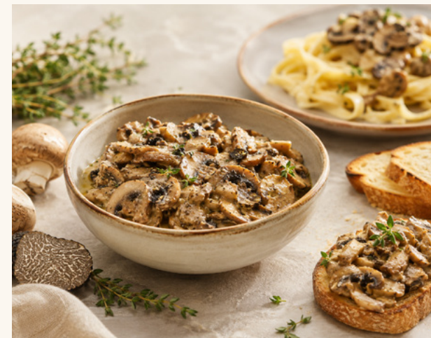
Émincé de champignons & truffes d'été bio Émincé fondant, parfait pour pâtes, risottos et toasts.