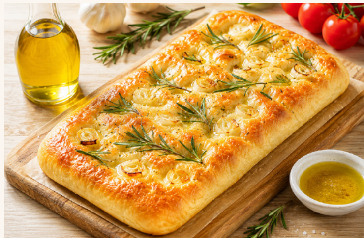
Focaccia nature bio

Pâte précuite à garnir selon l'inspiration