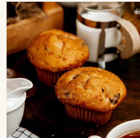
Muffin & pavé de campagne Complément salé-sucré du buffet.