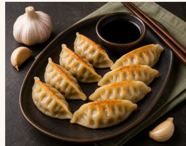
Gyoza poulet à l'ail Poulet parfumé à l'ail, frit-surgelé.