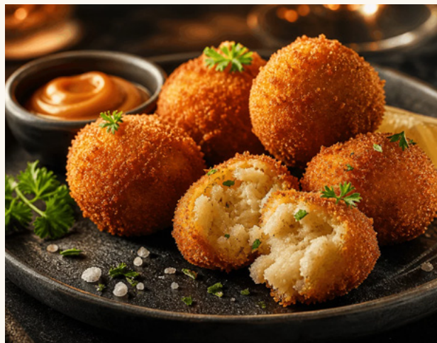
Croquetas à la morue

Cœur crémeux et panure dorée, la croqueta espagnole dans toutes ses déclinaisons.