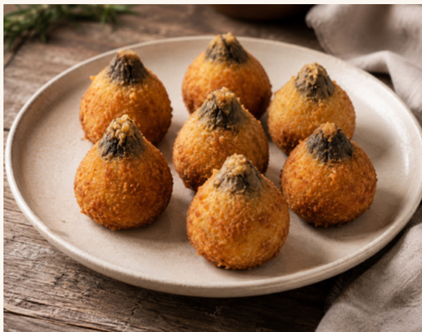
Fleurs de courgettes farcies Croustillantes, farce délicate, dressage soigné.

Beignets, fleurs farcies, barbajuan et panisse — l'apéritif du Sud.