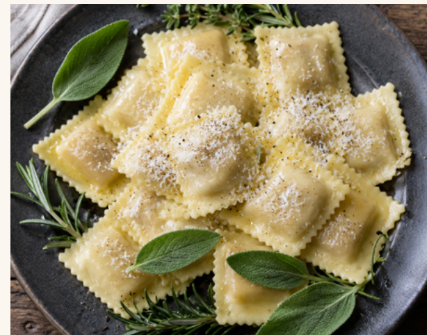
Ravioles de Romans traditionnelles bio La raviole de Romans authentique, fine et fondante.