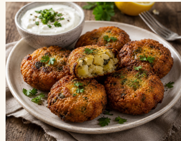
Beignets d'aubergine à la feta Aubergine fondante et feta, panure croustillante.