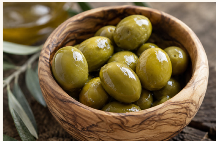
Olives vertes Charnues, fermes, idéales pour les tables de mezzé.