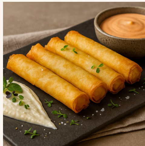
Rakakate au fromage Fins rouleaux croustillants au fromage fondant.