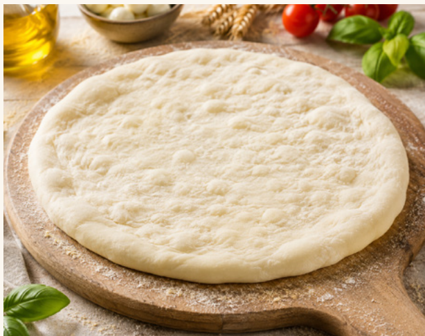
Pizza base nature

Le support idéal pour la créativité du chef, prêt à garnir.