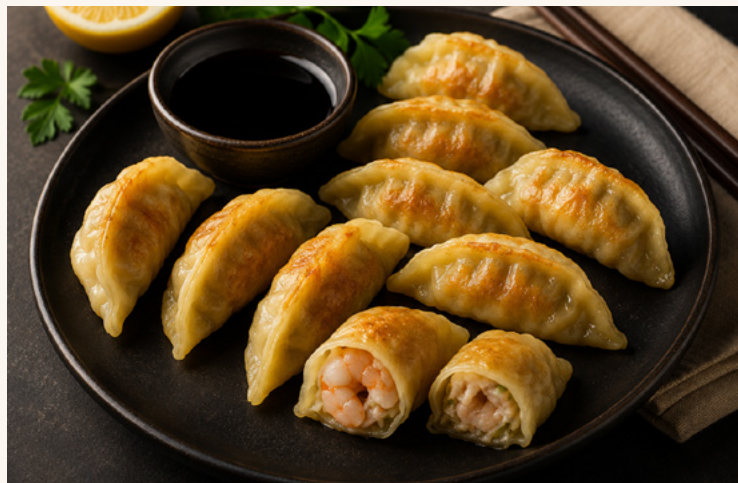
Gyoza crevettes Crevette généreuse, finition poêlée.