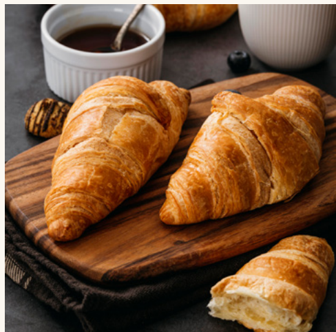
Croissant Précuit-surgelé, feuilletage doré.

Un moment clé de l'expérience client : diversité, goût et praticité.