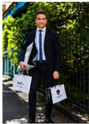
Le dirigeant qui allie avec passion le savoir, l'excellence des viandes et le sens du détail.