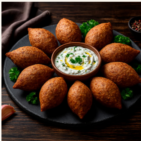
Kebbé à la viande de bœuf Coquille de boulgour croustillante, farce de bœuf épicée.

Croustillants à dresser en quelques minutes, du cocktail au repas assis.