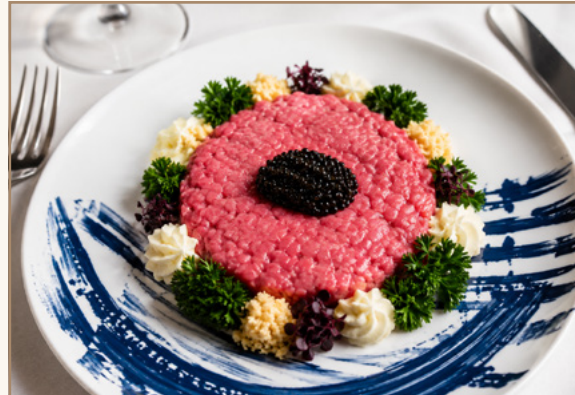
Carpaccio de bœuf black angus bio au caviar prunier Par le chef Eric Coisel, Au restaurant Prunier Au restaurant L'Orangerie (Hôtel George V)