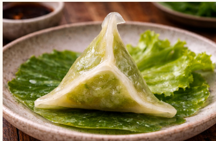
Ravioli étoile crevette & volaille

Double farce crevette et volaille, pliage en étoile.