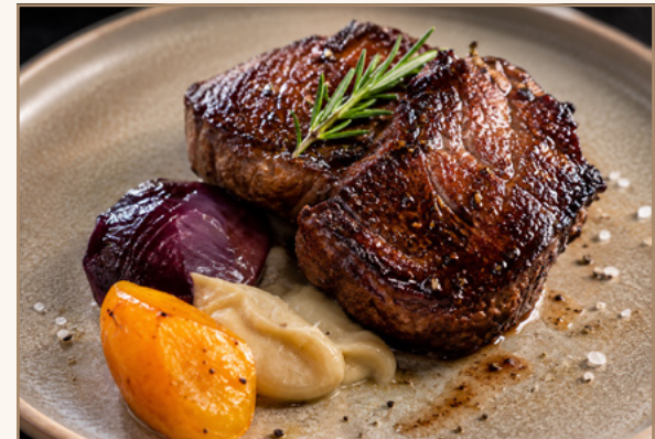
Noix d'entrecôte de Bœuf Black Bio Par le chef Pierre Gagnaire Au restaurant Pierre Gagnaire 3 Macabons