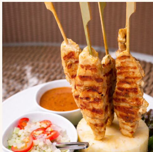
Brochettes Chiche Taouk

Le grill du Levant et les pains qui accompagnent chaque table.