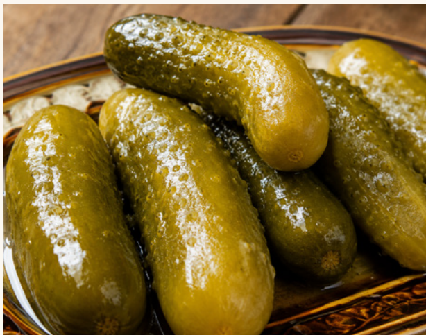
Kabis Concombres en saumure, croquants et acidulés.

L'apéritif du Levant : olives charnues et concombres en saumure.