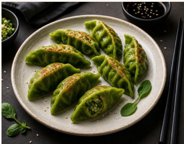
Gyoza légumes Farce végétale, pâte translucide grillée.