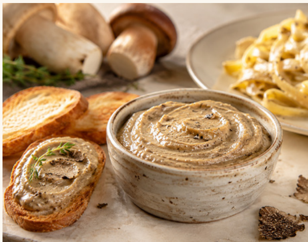
Crème de cèpes & truffe d'été Onctueuse, idéale pour pâtes et toasts.

De l'huile à la raviole, la signature truffée de la Maison.