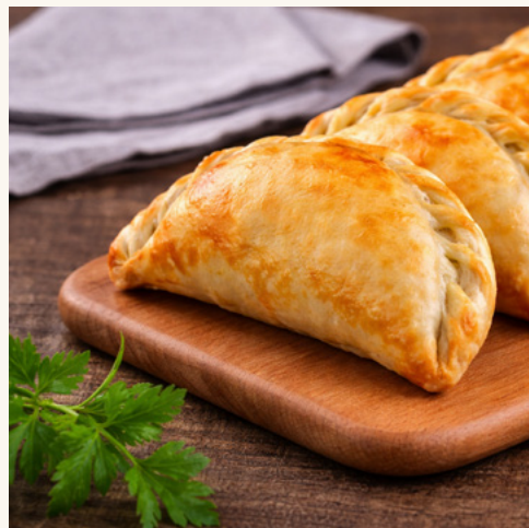
Samboussik à la viande de bœuf Petits chaussons farcis, frits à la perfection.