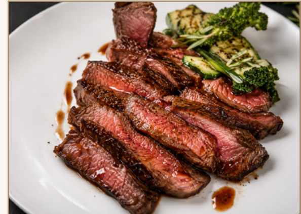
Côte de Bœuf Black Angus Bio Par le chef Richard Robe Au restaurant Le V (Hôtel Vernet)