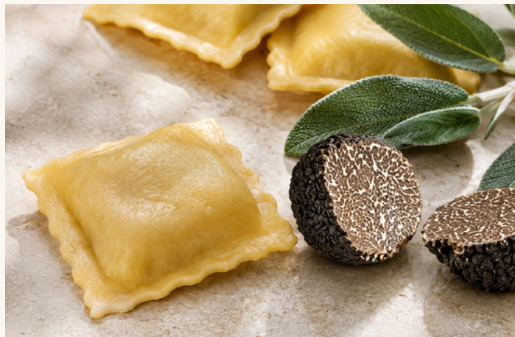
Ravioles à la truffe bio Ravioles de Romans revisitées à la truffe.