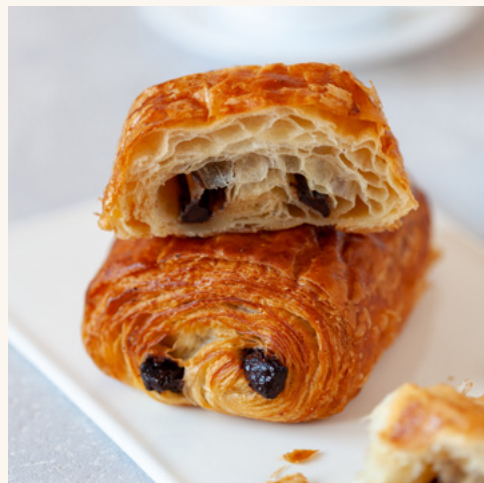
Pain au chocolat Beurre et chocolat, prêt à enfourner.