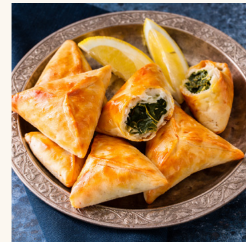
Fatayer épinard au Sumac Triangles aux épinards relevés d'une note acidulée de sumac.