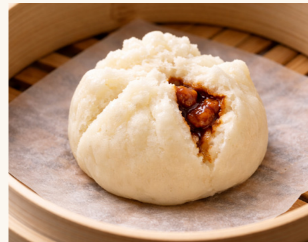
Brioche porc laqué

Garniture végétale parfumée, vapeur ou poêlée.