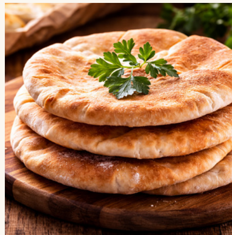
Pain pita bio

Galette souple, bon goût de noisette grillée.