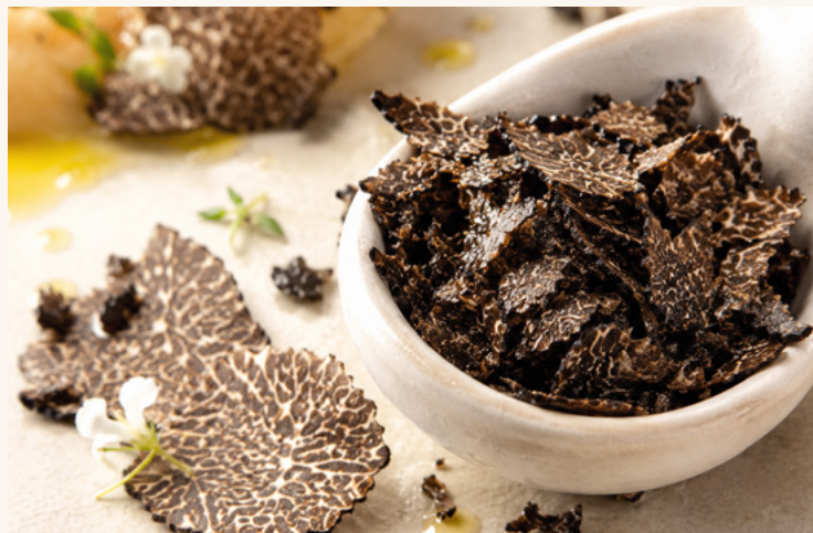
Brisures de truffe bio Éclats de truffe pour intensifier un plat.