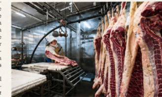
La mise à mort industrielle dérange de nombreux Suisses, surtout chez les jeunes.

« Ils ne se sentent pas responsables. Ils estiment que c'est au monde politique et aux producteurs d'agir », résume la chercheuse. «Token Soemhausen, président de l'un en Fokks, association qui se préoccupe de la bien-être des animaux et qui a commandé l'enquête. «C'est clair dispose des nombreux élevés de poussants soutiennent fermes les abattoirs», souligne.