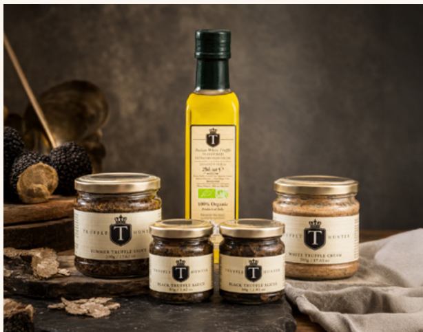
Arancini à la truffe extra avec bille de mozzarella.

De l'huile à la raviole, la signature truffée de la Maison.