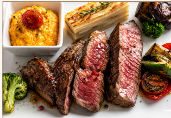
Côte de bœuf Angus Bio Par le chef Fabrizio Dom ilici Au restaurant de l'hôtel Starling à Genève